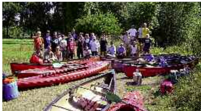
Ausflüge, wie die Paddeltour auf der Ilmenau, fördern die Geselligkeit der Abteilung.

Gründung: 1920 Mitgliederzahl: 657 (davon 72 in der Abteilung Tischtennis) Mannschaften: 9 Vereinsfarben: Gelb-Schwarz Homepage: www.tsv-wrestedt-stederdorf.de