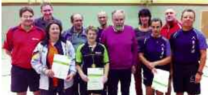
Sieger und Platzierte der Senioren-Kreismeisterschaften.