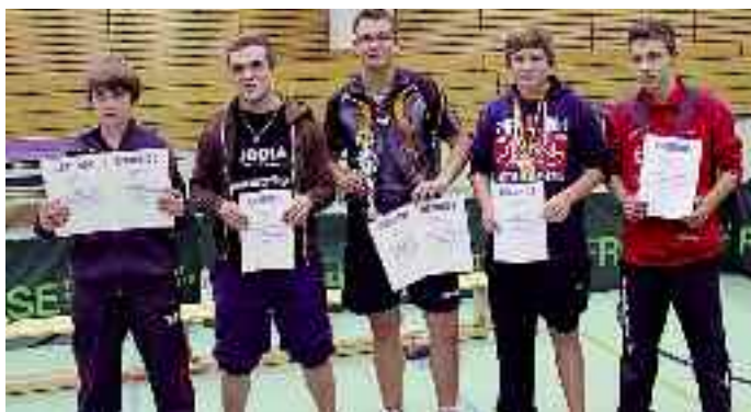
Bei den Jungen landeten die Nachwuchstalente des MTV Jever und des Heidmühler FC auf den vorderen Plätzen. Beide Teams treffen in dieser Saison auch in der Niedersachsennliga aufeinander..