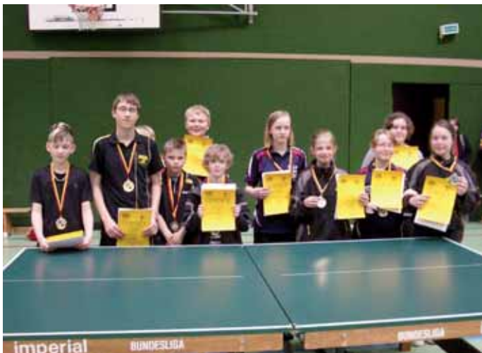
Die Teilnehmer der Jugend- und Schülerklassen bei der Siegerehrung.