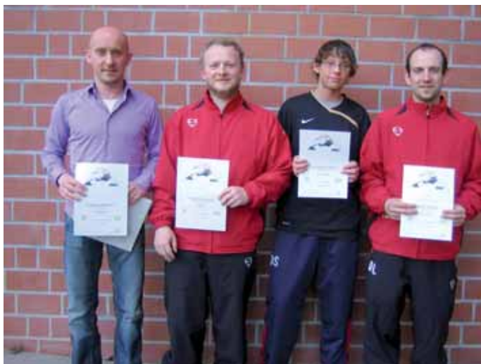
► In der Herren A-Konkurrenz triumphierte der SC Marklohe.