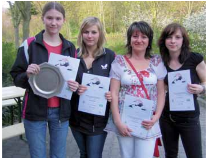
► Die Damen des TSV Watenbüttel waren in der A-Klasse nicht zu schlagen.