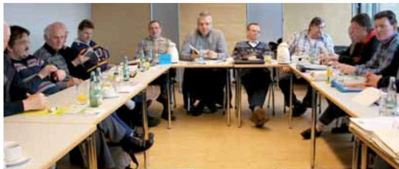
► Die Teilnehmer lauschen den Referenten.