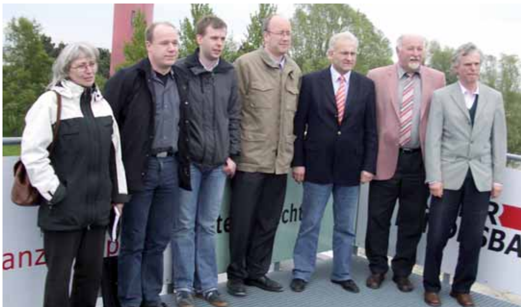
► Den Hafen hinter sich, die neue Aufgabe vor sich – Teile des neuen Vorstandes bei der Besichtigung des JadeWeserPorts.