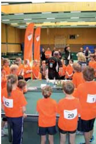
► Siegerehrung bei den Minis.