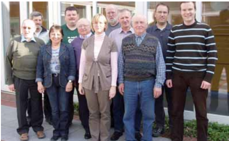
► Die Teilnehmer an der VSR Fortbildung.

Der beliebte schriftliche Test, wo jeder noch mal testen kann wie regelfest er ist war ein kleiner Höhepunkt an diesem Tage, alle gestellten Fragen wurden nach-