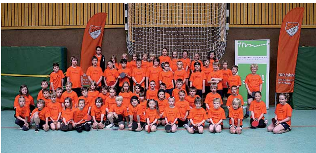
► Alle Kinder stellen sich dem Gruppenbild.