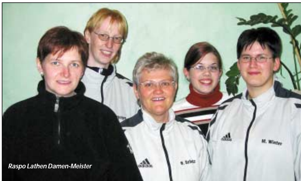
Raspo Lathen Damen-Meister