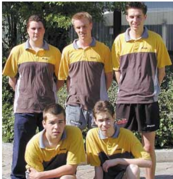
Mit einer fast komplett neuen Mannschaft verteidigte der TSV Bremervörde seinen Titel bei den Norddeutschen Jugend-Mannschaftsmeisterschaften.