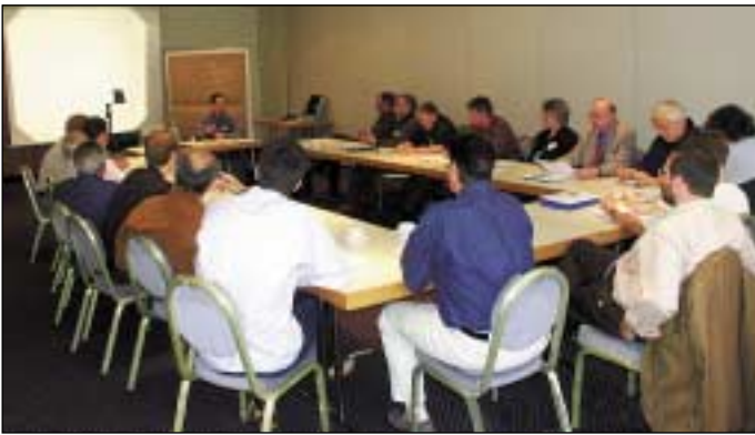
Die Teilnehmer beim „Arbeiten“.