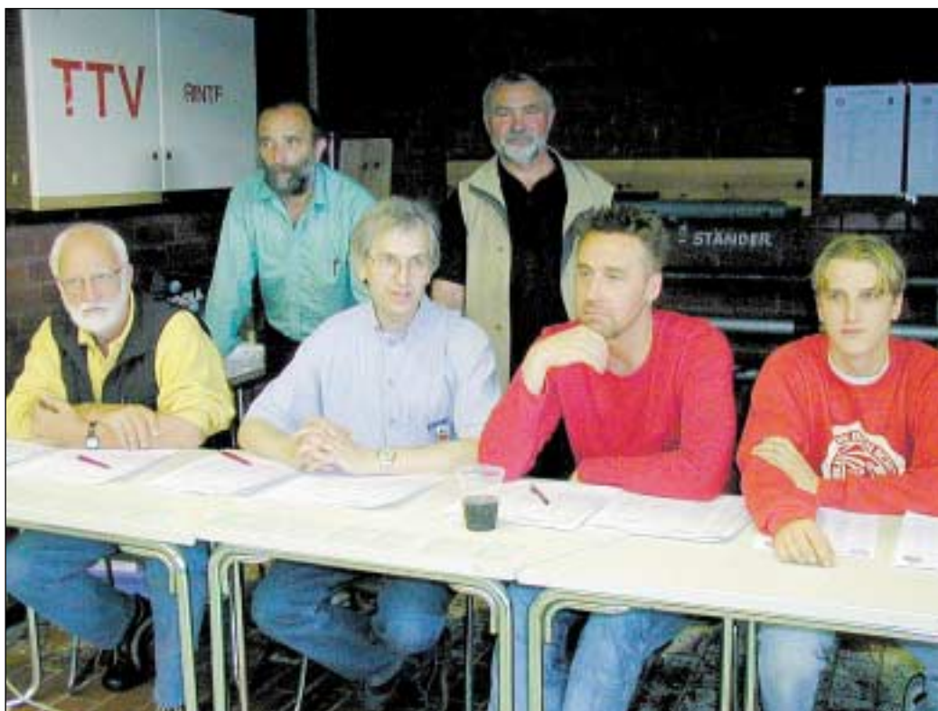
Die Turnierleitung des TSV Todenmann-Rinteln hatte alles bestens im Griff und wurde von allen Seiten für die geleistete Arbeit gelobt.