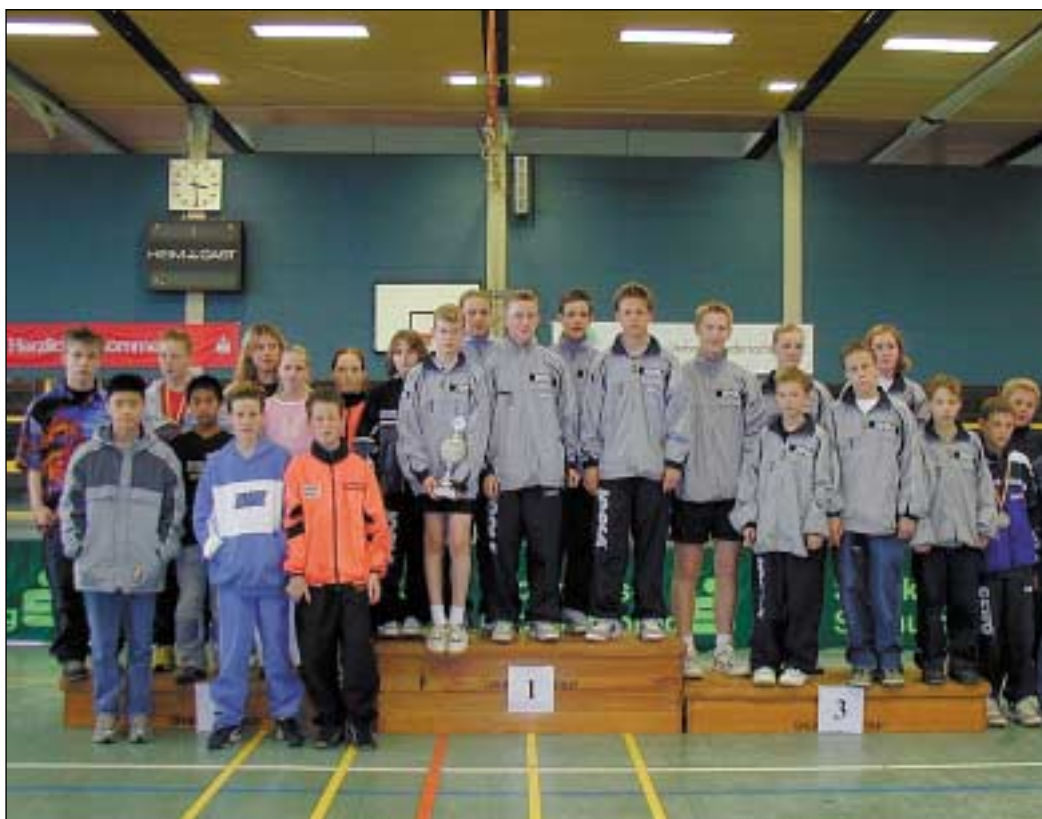
Die Siegerteams des Grand Prix 2003.

Ziel des TTVN-Schüler-Grand-Prix ist es, den teilnehmenden Schülern über den regelmäßigen Wettkampfbetrieb hinaus die Möglichkeit zu geben, gegen möglichst viele starke Gegner zu spielen. „Die 14 Mannschaften