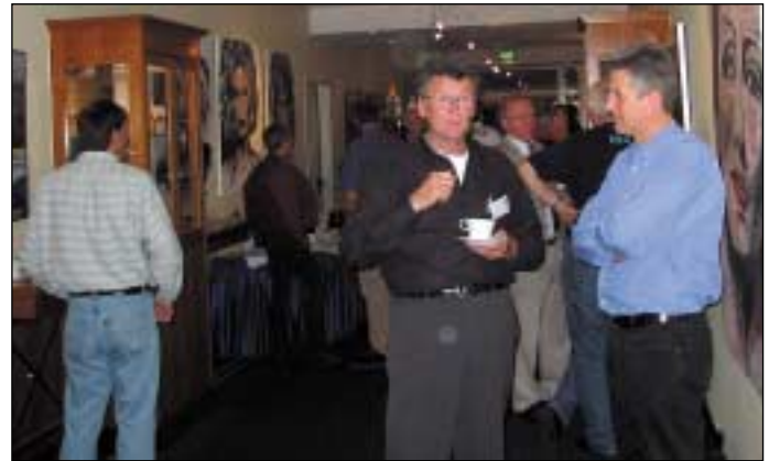
Gespräch von Teilnehmern während einer Pause.

Am Abend dann wurde in s.g. „Fachstammtischen“ bei Kaltgetränken der Meinungs austausch gepflegt, was sich als sehr wichtig erwies, denn die Teilnehmer, mit einem sehr unterschiedlichen Hintergrund was ihre Tätigkeit im Sport betrifft und auch eine unterschiedliche Sichtweise, wohin sich die Sportart Tischtennis entwickeln soll, woll-